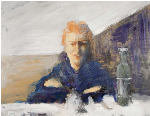
Acht und neunzig Seiten Mischtechnik auf Leinen 100x130 cm 2015 Charim Events 4200.-