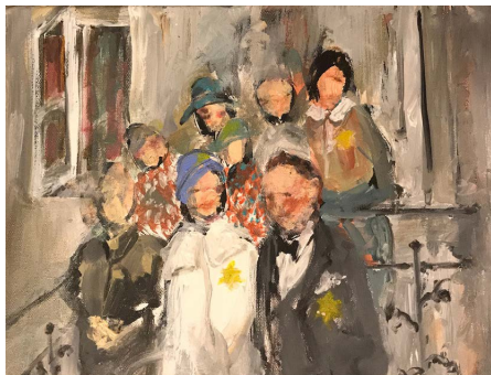
o.T. Mischtechnik auf Leinen Gerahmt 30x40 cm 2017 2500.-