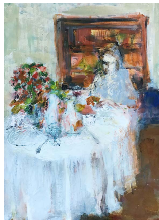
o.T. Mischtechnik auf Leinen Gerahmt 70x50 cm 2017 2900.-