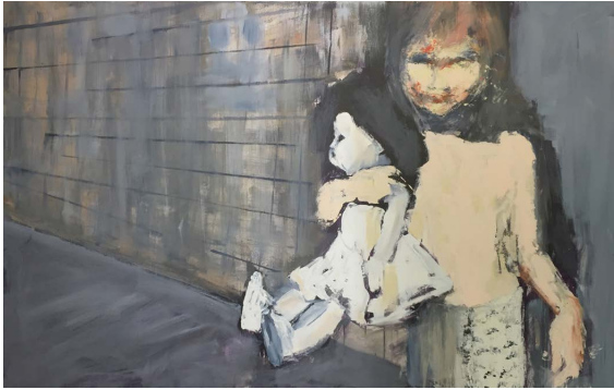
1960 Mischtechnik auf Leinen 100x160 cm 2014 4200.-