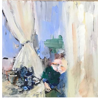
o.T. 4Teile Mischtechnik auf Leinen Gerahmt 40x40 cm 2017 Jeweils 2500.-