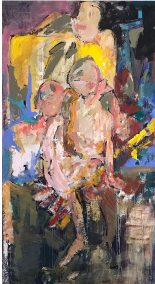
Straight Mischtechnik auf Leinen 200X104cm 2017 8500.-