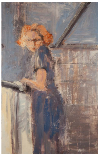
Acht und neunzig Seiten Mischtechnik auf Leinen 160x100 cm 2015 Charim Events 4200.-